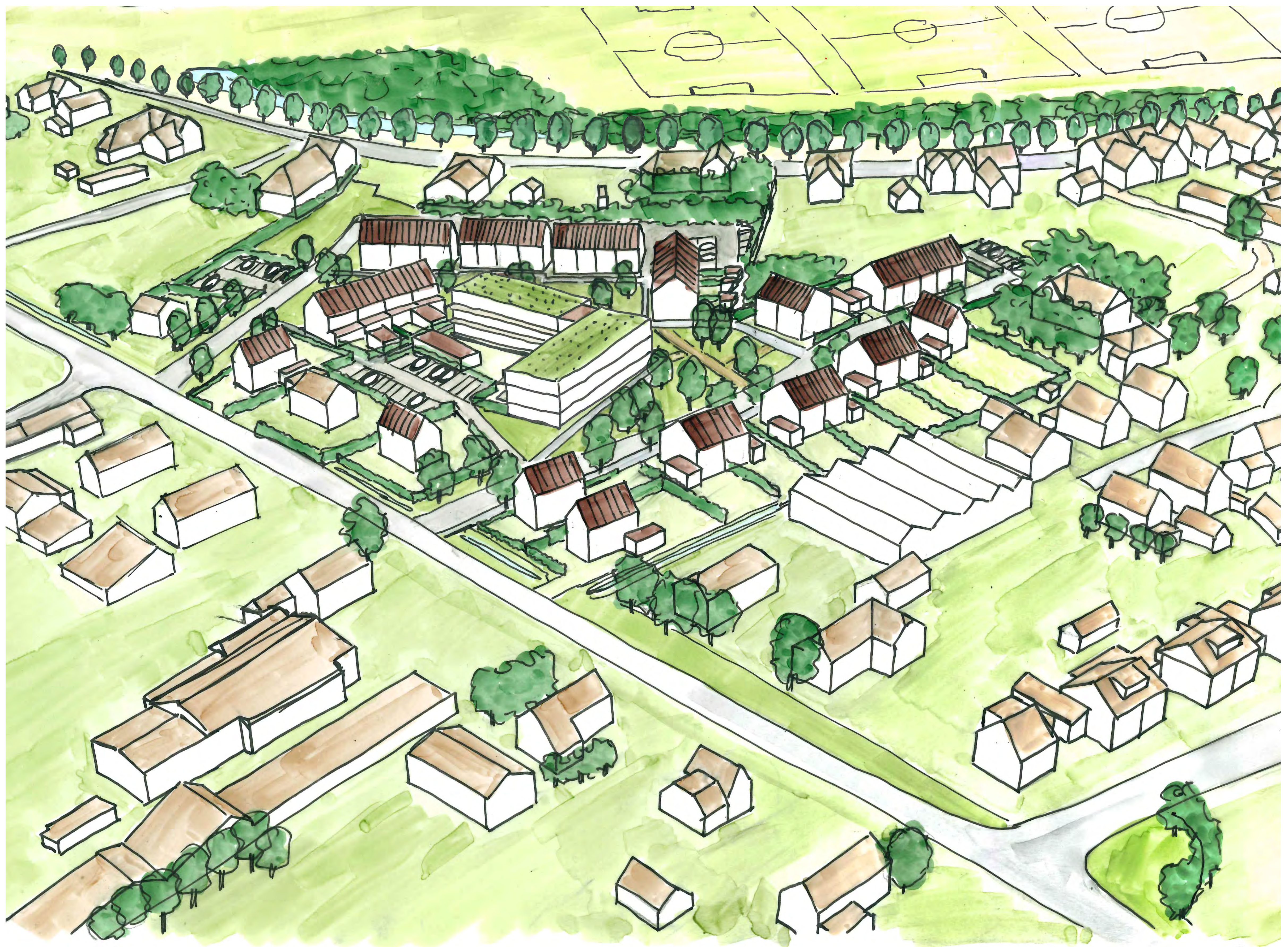
3D schetsimpressie juli 2025