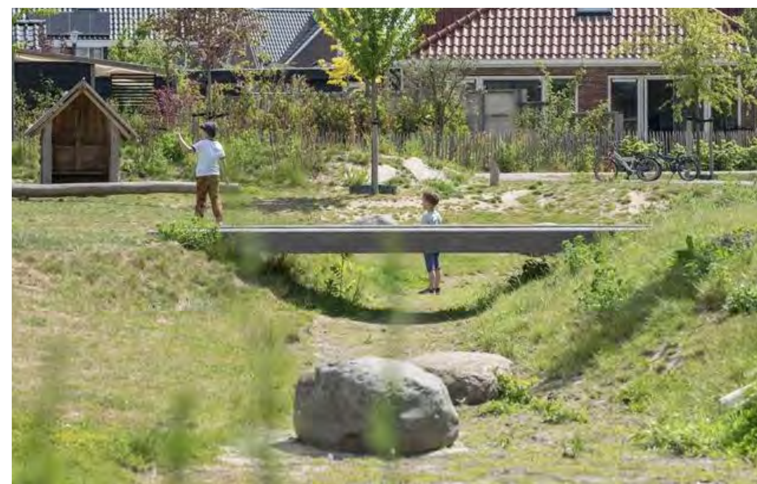
Wadi met speelaanleidingen