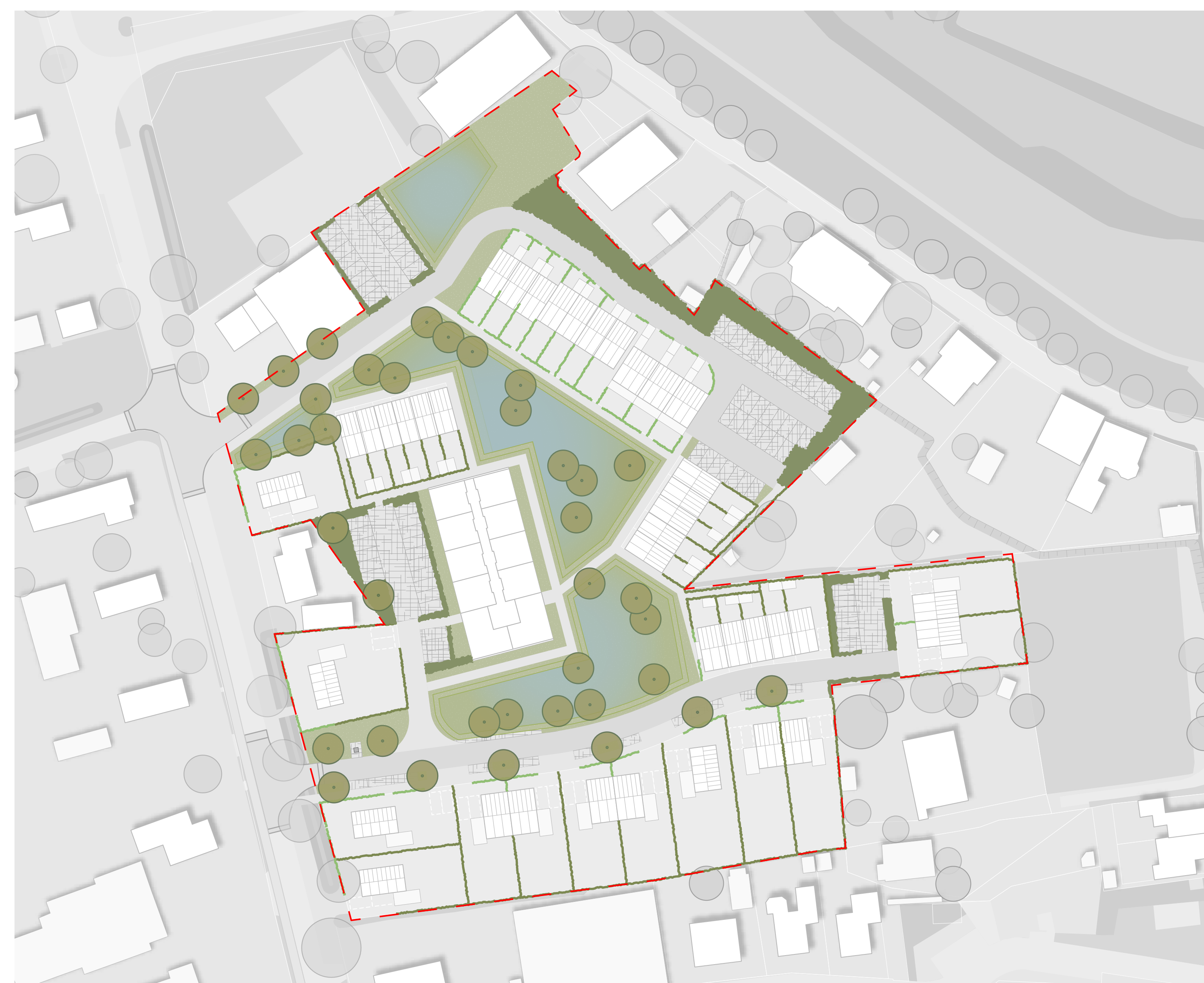
Groen en waterberging