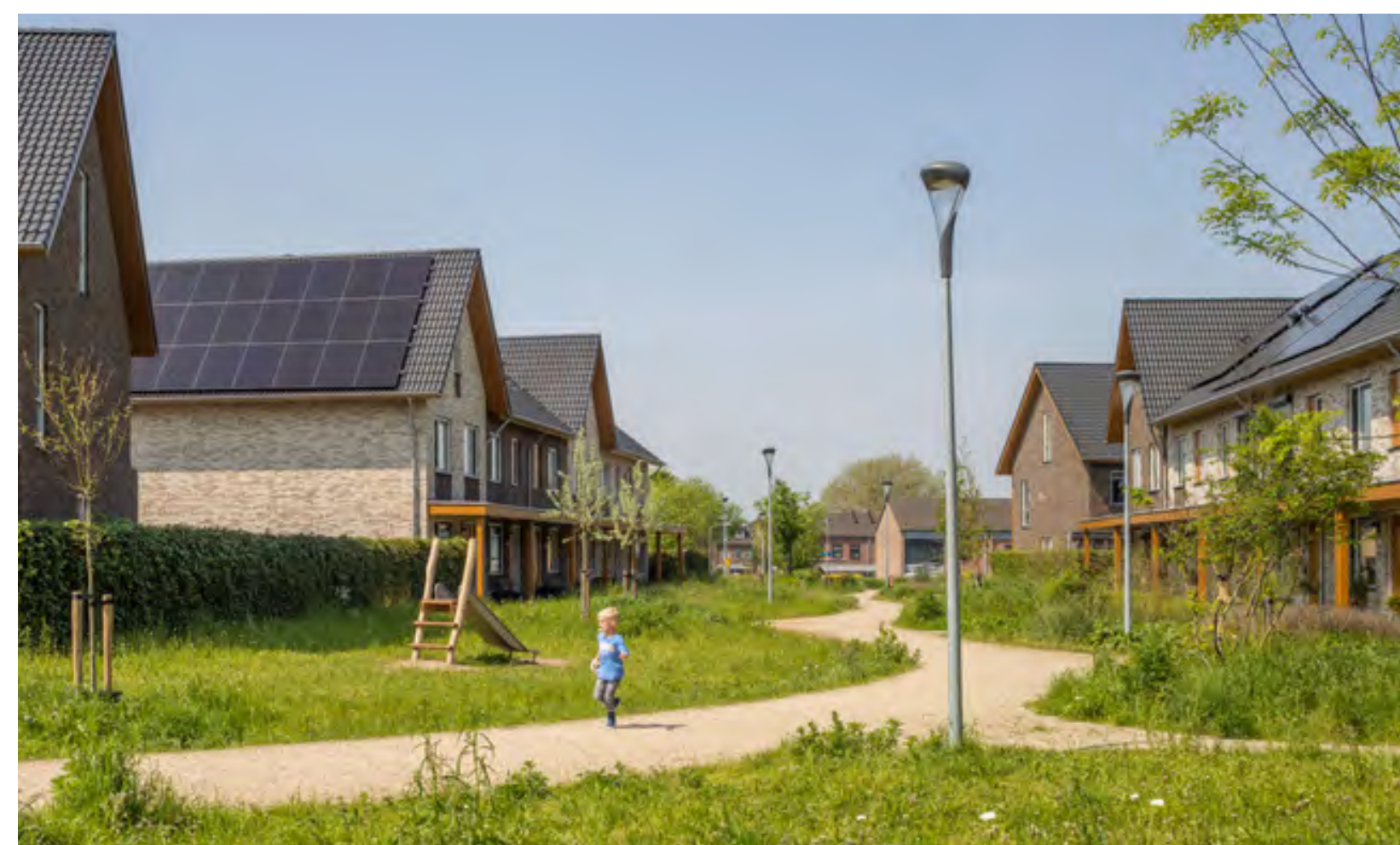
Autovrije, groene ruimte tussen de woningen