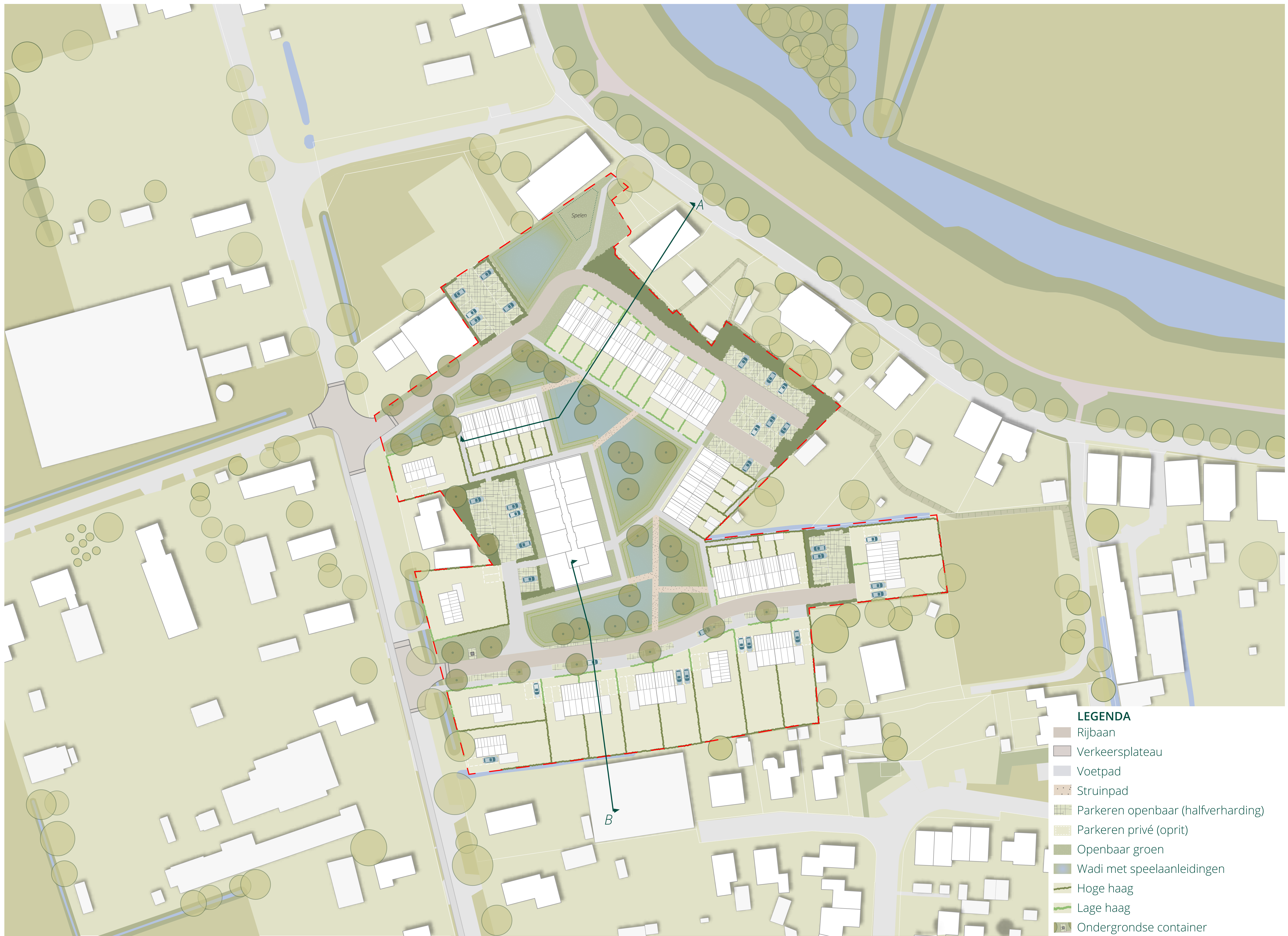
Concept stedenbouwkundig plan, schaal 1:500