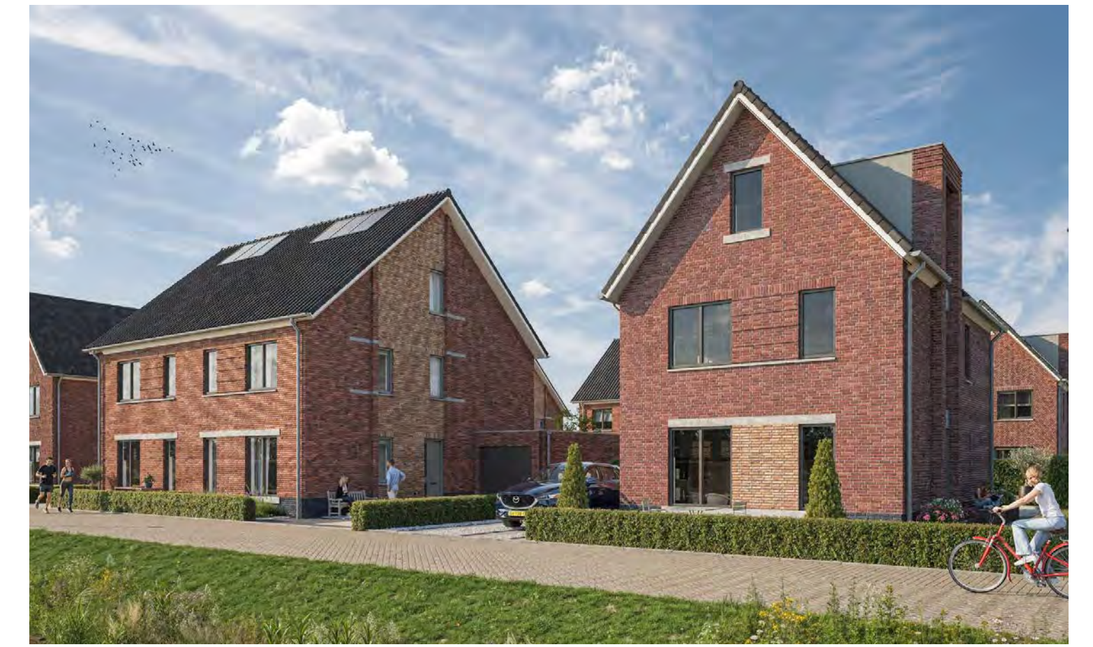
Referentie vrijstaande- en twee-onder-een-kapwoningen