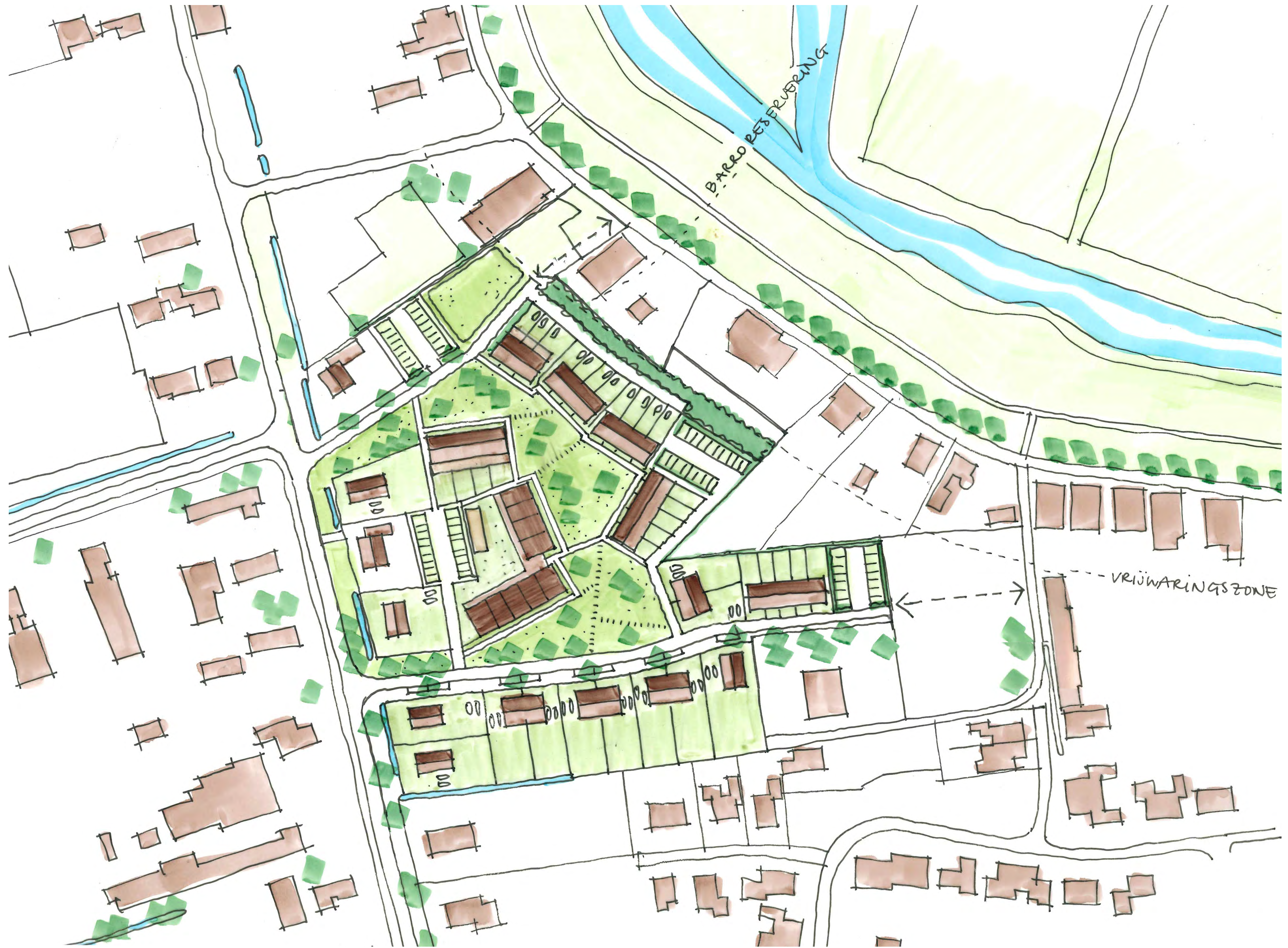
Stedenbouwkundig schetsplan juli 2025