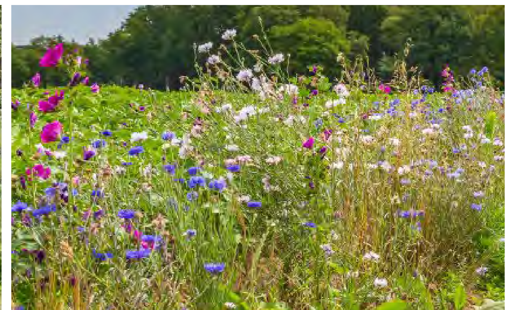
Toepassen van natuurlijke planting voor biodiversiteit en waterberging