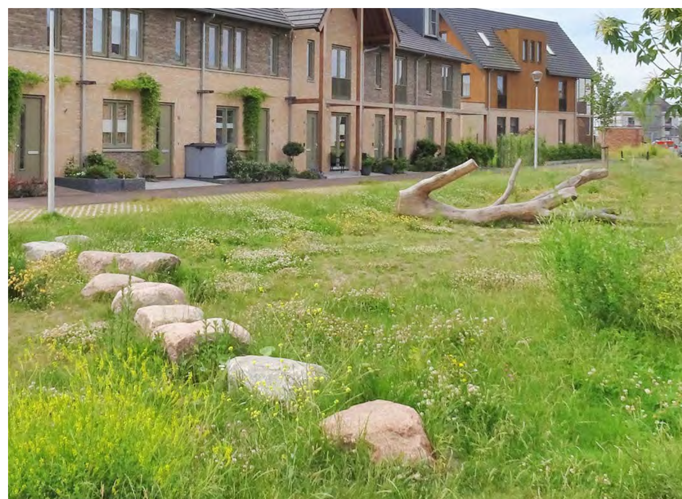
Stapstenen door de verlaagde groene ruimte/wadi